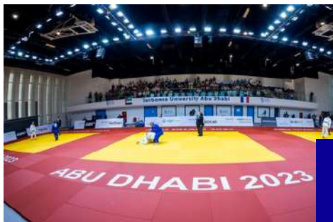
CHAMPIONNAT DU MONDE VÉTÉRANS