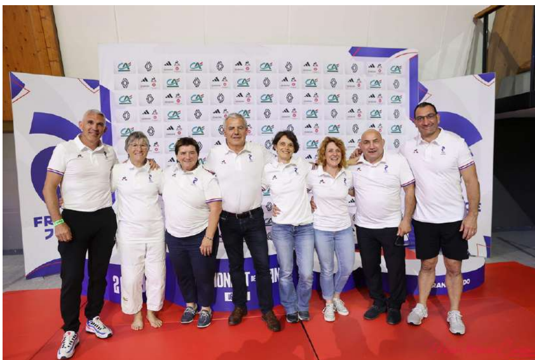
Membres du GT présents au Championnat de France Vétérans 2023