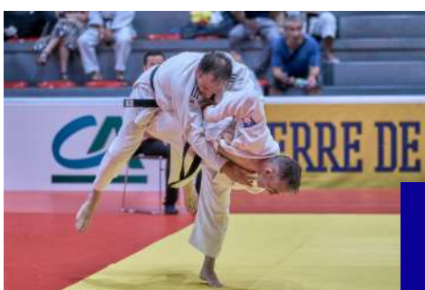
COMPÉTITIONS ET STAGES

Le GT se décline en plusieurs commissions qui ont pour objectifs d'aborder les thématiques suivantes :