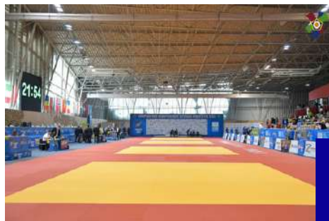
CHAMPIONNAT D'EUROPE VÉTÉRANS